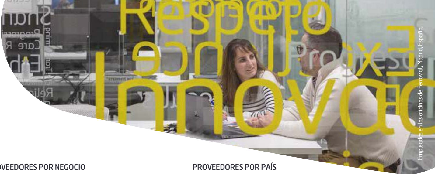
Empleados en las oficinas de Ferrovial, Madrid, España.